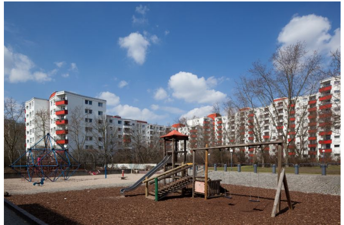
Innenhof mit Spielmöglichkeit

Objekt-Nr.: 10-00919-0171-G Verfügbarkeit: 01.09.2019