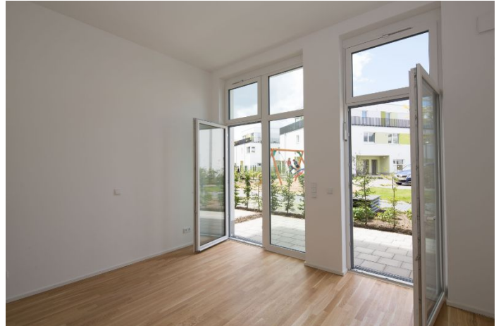
Zimmer mit bodentiefen Fenstern

Objekt-Nr.: 10-01266-1069-G Verfügbarkeit: nach Vereinbarung