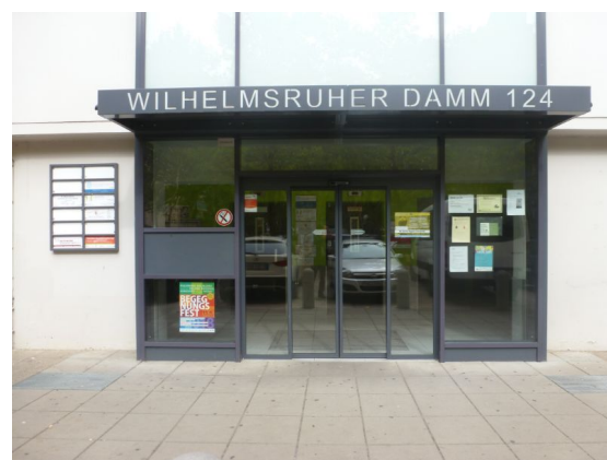
Eingangsbereich unweit Märkisches Zentrum