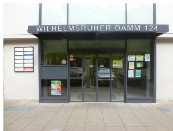
Eingangsbereich unweit Märkisches Zentrum