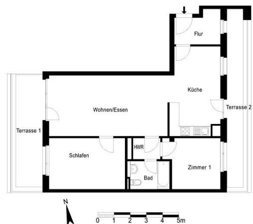
Grundriss (ohne Gewähr)

119 neue Wohnungen mitten in Wilhelmsruh: ausgestattet mit Fußbodenheizung, modernen Bädern und Balkone, Loggien oder Terrassen an allen Wohnungen. Dies könnte Ihr neues Zuhause sein! Alle Wohnungen sind mit einem Aufzug erreichbar und somit für jedes Alter geeignet. Schauen Sie vorbei und lassen sich begeistern.