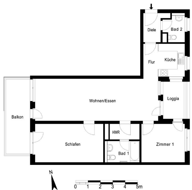
Grundriss (ohne Gewähr)

Bedarfsenergieausweis Baujahr: 2017 Wesentlicher Energieträger: Fernwärme Energieeffizienzklasse: B Erstellungsdatum: 03.05.2018