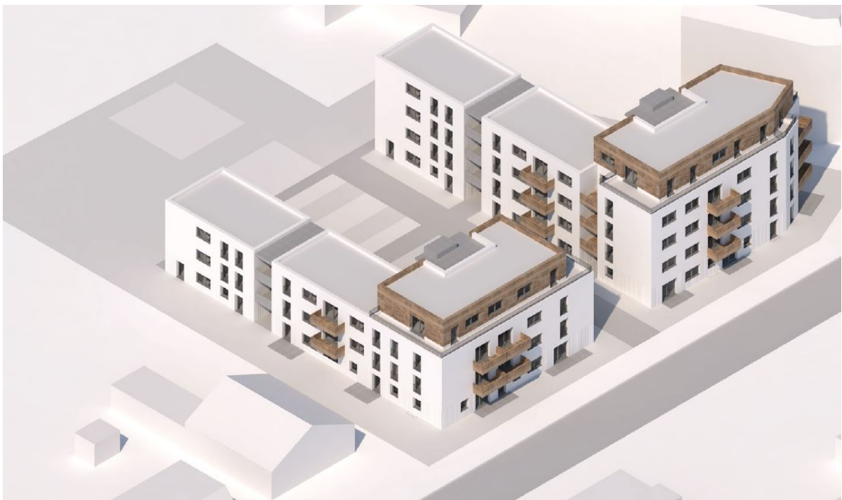
Treskowstraße 7-9: Isometrie West