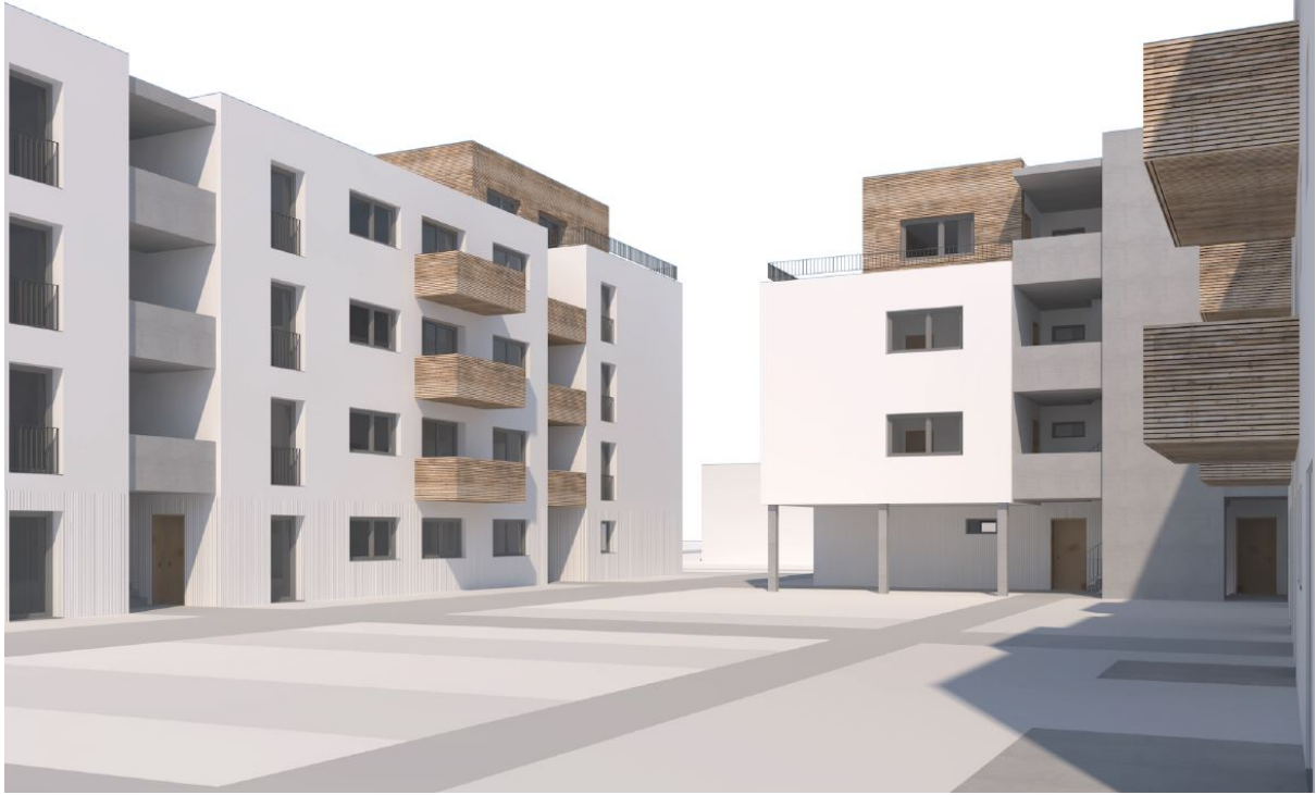
Treskowstraße 7-9: Perspektive Innenhof