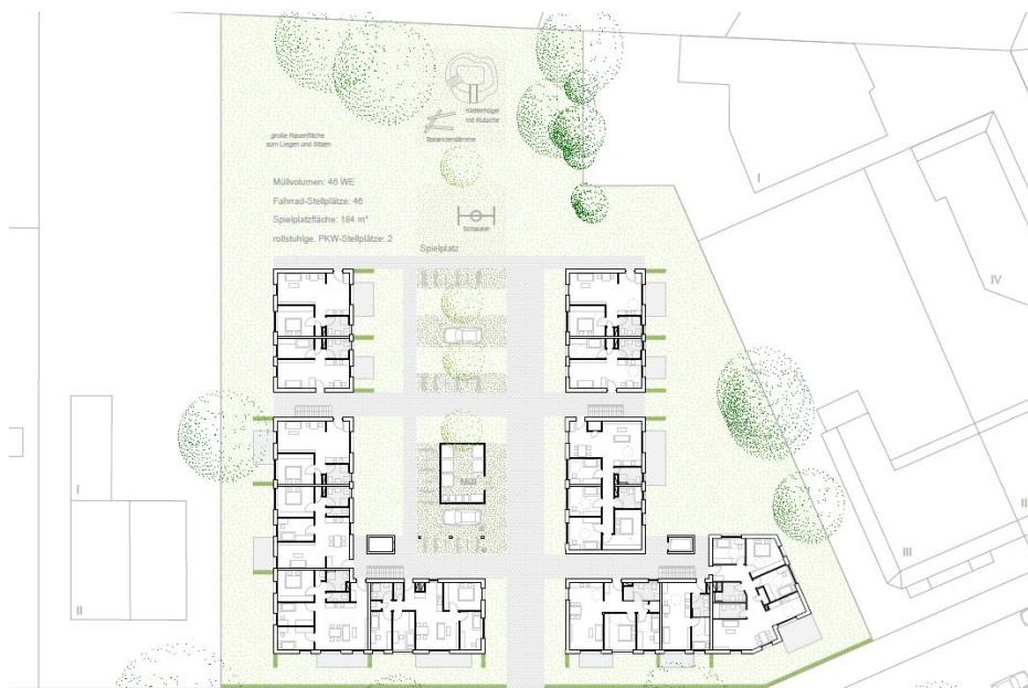
Treskowstraße 7-9: Außenanlagenplan

Auf dem Gelände Treskowstraße 7-9 entstehen 46 Wohnungen; rund ein Drittel (37 Prozent) werden als geförderte Wohnungen zu Nettokaltmieten ab 6,50 € vermietet.