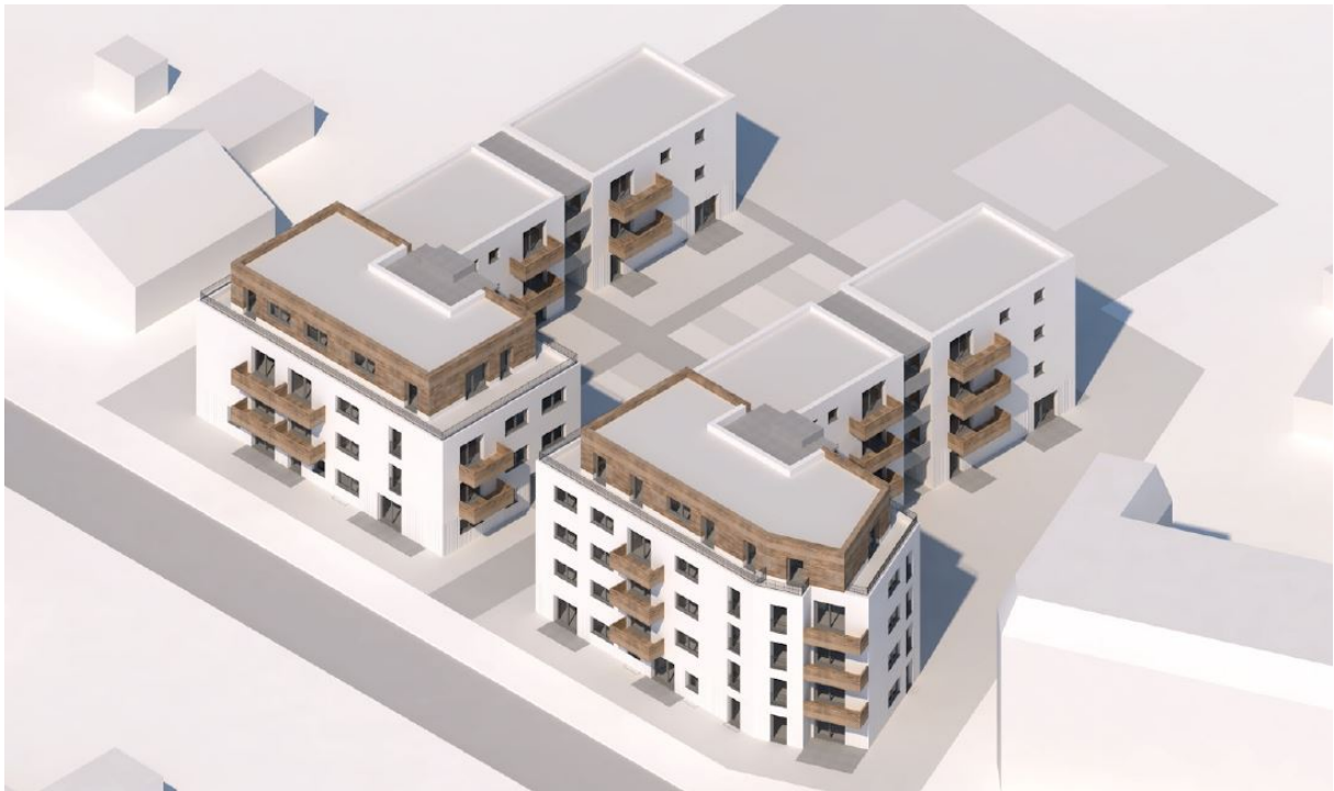
Treskowstraße 7-9: Isometrie Ost