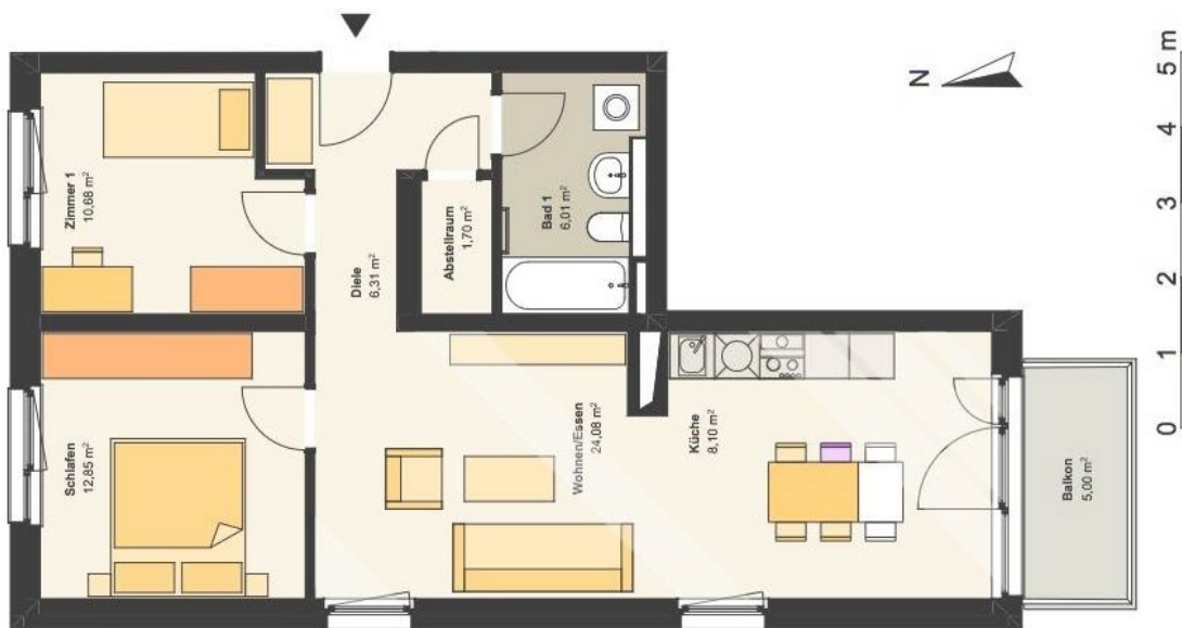
Abbildung: Beispielgrundriss 4-Zimmer-Wohnung