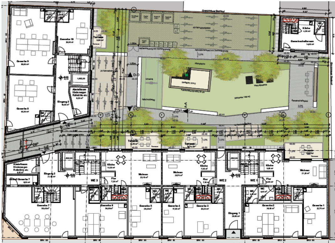
Langhansstraße 28, Roelckestr. 9, 9A: Grundriss 1. Obergeschoss Bildquelle: Bollinger + Fehlig Architekten GmbH