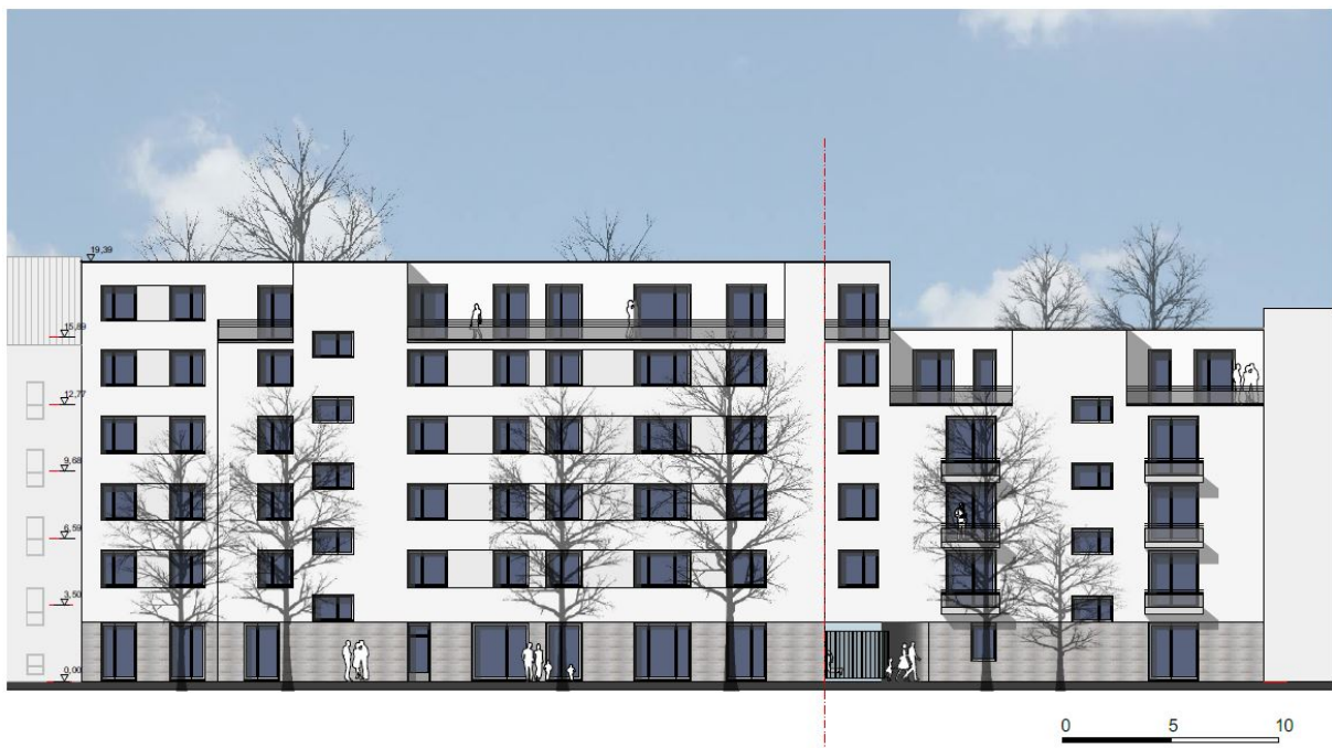
Langhansstraße 28, Roelckestr. 9, 9A: Ansicht Hof