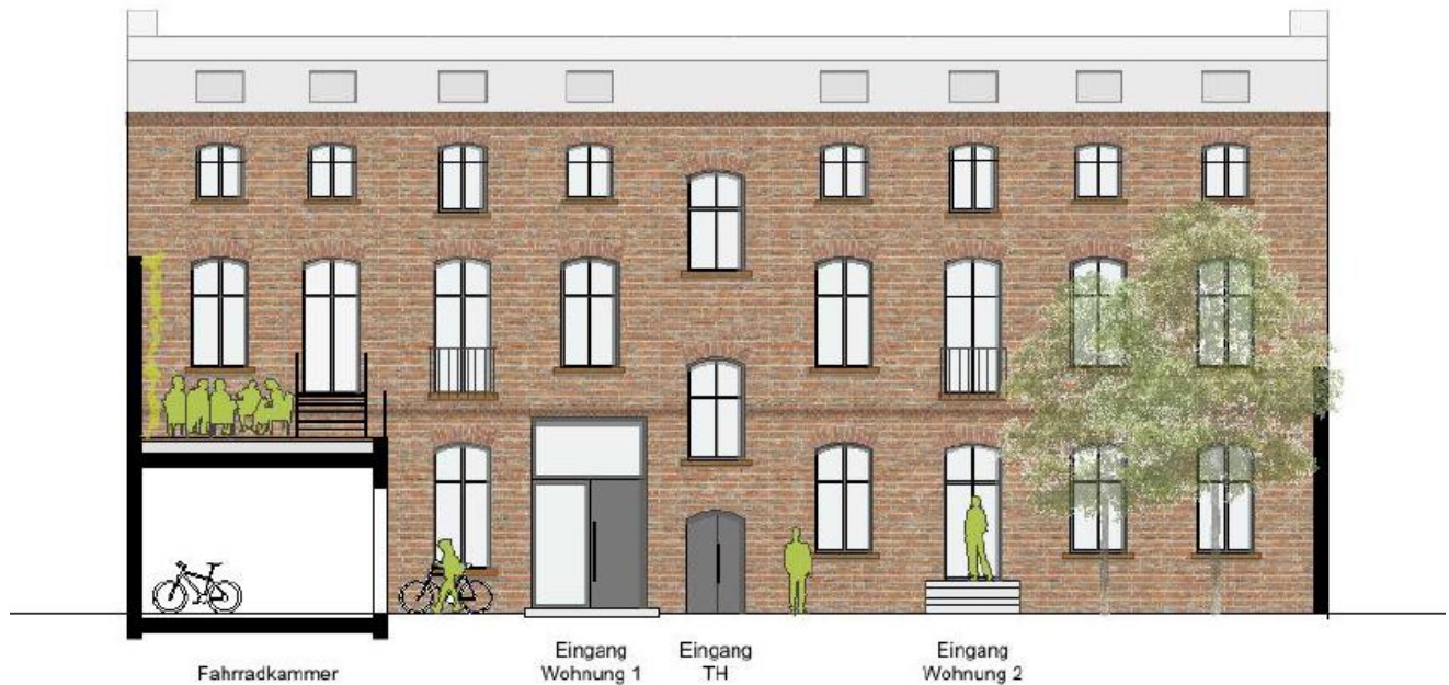
Alte Tischlerei: Ansicht Nord-West Bildquelle: Clarke und Kuhn freie Architekten BDA