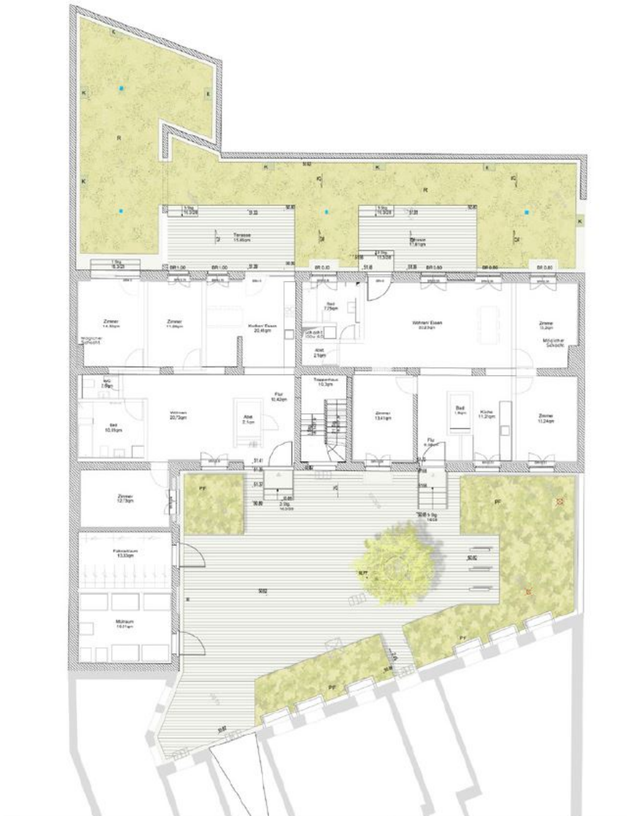
Grundriss Alte Tischlerei

Bildquelle: Clarke und Kuhn freie Architekten BDA